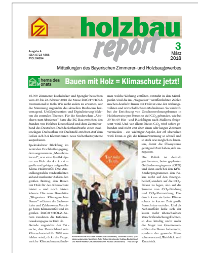
Mitteilungsblatt holzbau report