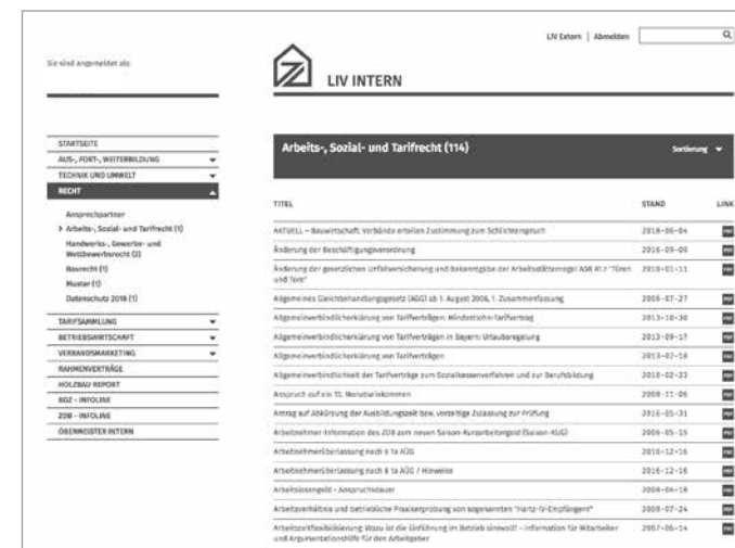
LIV Intern: exklusiver Mitgliederbereich