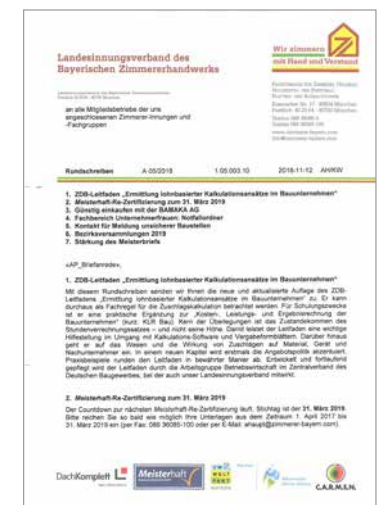
Rundschreiben für Mitglieder